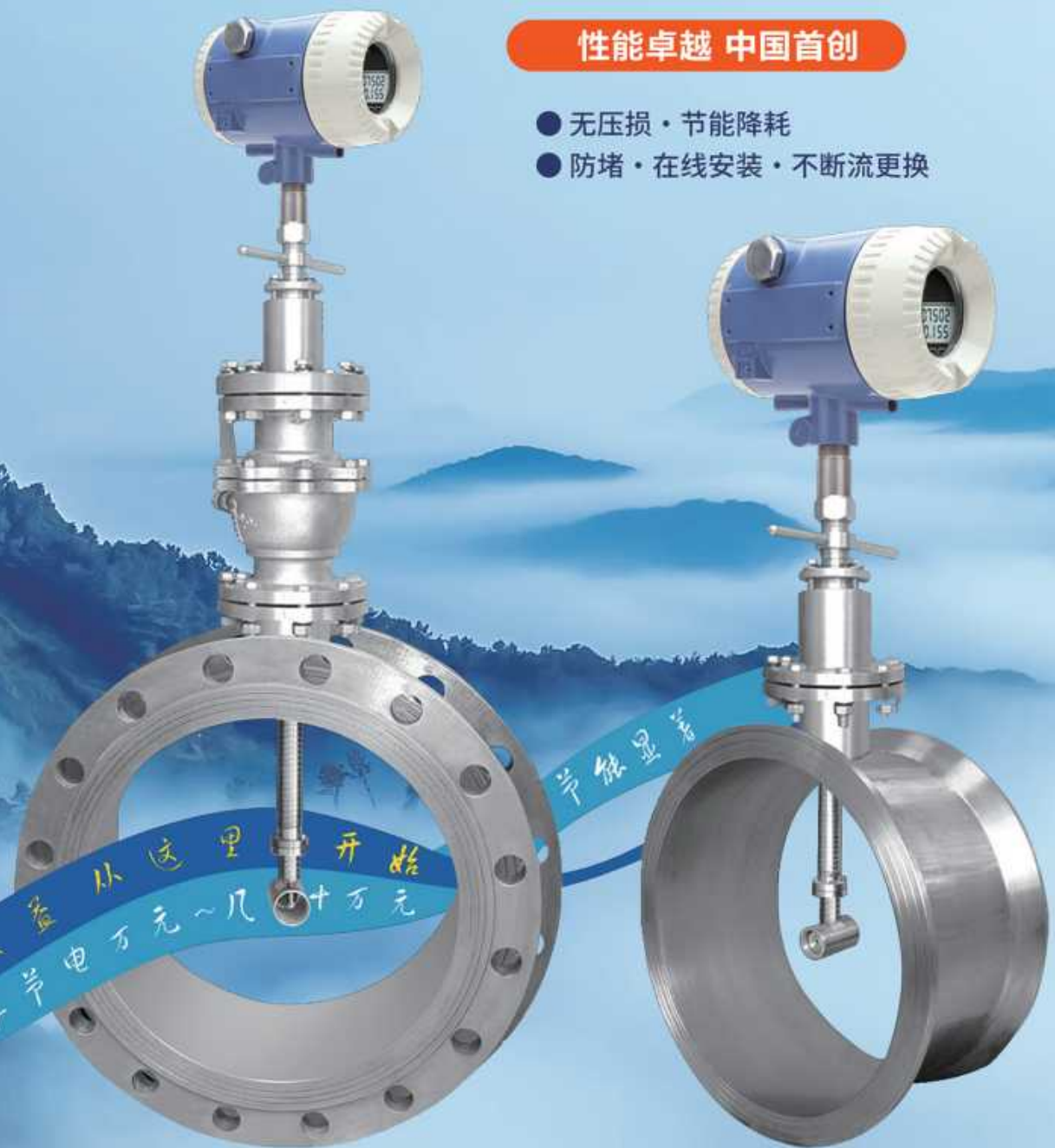
球阀不断流更换型 LUGG-4GAQ/4GBQ LUGG-5GAQ/5GBQ