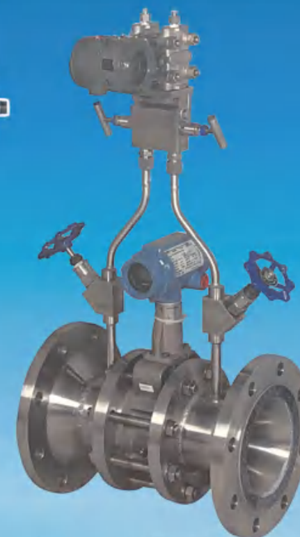
GMF200型 双参量气体质量流量计