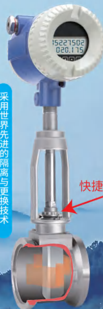
法兰卡装型-无探头杆 LUGG-5GA/5GB