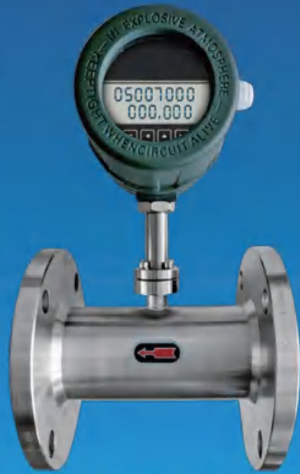
热式气体质量流量计