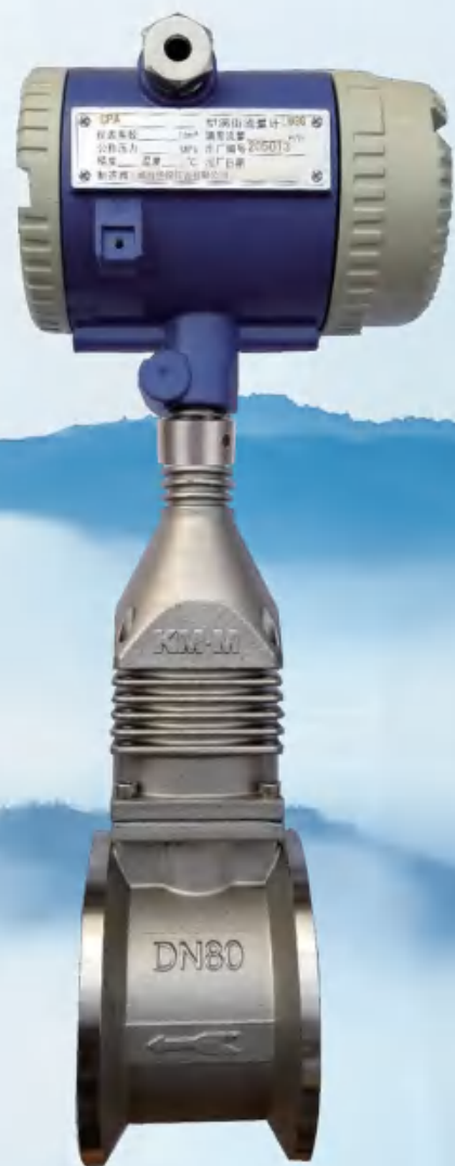
法兰卡装型-有探头杆 LUGG-4GA/4GB