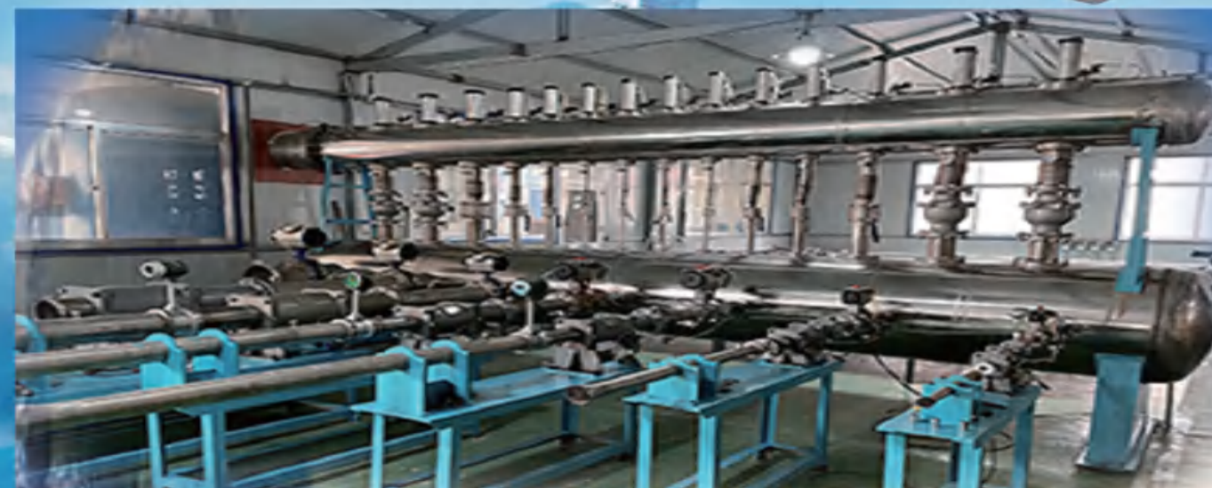
1~5000m 3 /h 音速标定装置