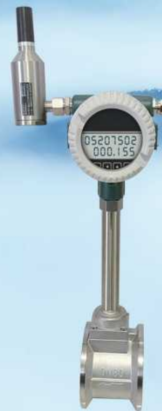
法兰对夹式无线远传涡街流量计 LUB - DN 口径 量程比: 10: 1 15: 1 ● 适应于温度 -20~350°C 以下